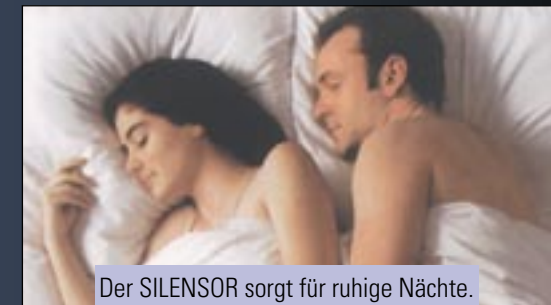
Der SILENSOR sorgt für ruhige Nächte. Reden Sie mit Ihrem Zahnarzt.