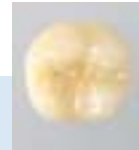
Zahnfarbene Füllungen mit hoher Haltbarkeit und einem Plus an Ästhetik

Kunststoffe gibt es in vielen verschiedenen Ausführungen sowohl für direkte Füllungen als auch für Inlays. Ein Vorteil von Kunststofffüllungen ist die Möglichkeit, sie vollflächig an der Zahnschicht zu befestigen und dadurch den beschädigten Zahn zu stabilisieren. Vor allem aber lässt sich Kunststoff – im Unterschied zu Amalgam – farblich den natürlichen Zähnen perfekt anpassen. Allerdings ist der Aufwand für eine Füllung aus Kunststoff extrem hoch, weil sie in vielen einzelnen Schichten modelliert werden muss.