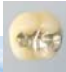
Amalgam: haltbar, aber nicht unumstritten

Das seit mehr als 100 Jahren verwendete Amalgam ist preisgünstig, einfach zu verarbeiten und lange haltbar. Von den kontroversen Diskussionen um das Amalgam hat sicherlich jeder schon einmal gehört. Die offizielle Lehrmeinung hält sie für unbedenklich. Dennoch wird empfohlen, Amalgam unter bestimmten Voraussetzungen nicht zu verwenden.