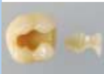
Inlays: Hochpräzise gefertigt und perfekt eingesetzt

Inlays aus Goldlegierungen, Keramik oder Kunststoff werden außerhalb des Mundes angefertigt. Danach setzt sie der Zahnarzt in den Zahn ein. Das setzt voraus, dass Zahnarzt und Zahn-techniker exakt und präzise zusammenarbeiten. Das bedeutet aber auch deutlich höhere Kosten als bei direkten Füllungen. Im Vergleich haben Inlays unübertroffene Vorteile: Sie sind sehr lange haltbar, biologisch gut verträglich und bieten zudem eine optimale Ästhetik. Insofern sind sie auf lange Sicht vergleichsweise preiswert.